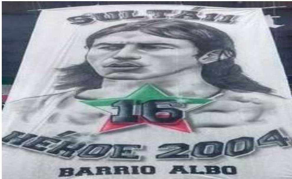
Figura 28. Telón en homenaje a Elkin Soto