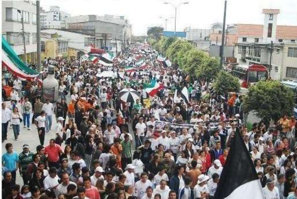
Figura 40. Desfile de conmemoración sobre la Avenida Santander en Manizales