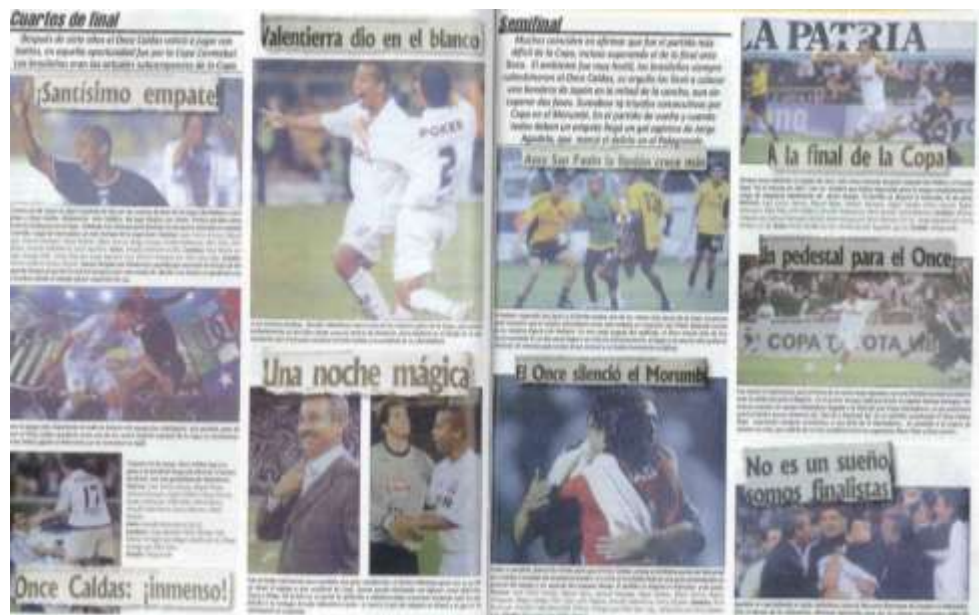
Figura 8. Semifinal de la Copa Libertadores del año 2004