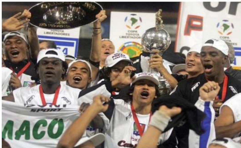
Figura 20. Jugadores del Once Caldas con las medallas y la Copa Libertadores

de orgullo a un país entero. Todos estos elementos son estimulantes y permiten que las emociones broten durante la celebración, en este caso, se manifestó la euforia de una manera desenfrenada que la copa sufrió una avería, es decir, la celebración fue tanta que se rompió el elemento simbólico del triunfo.