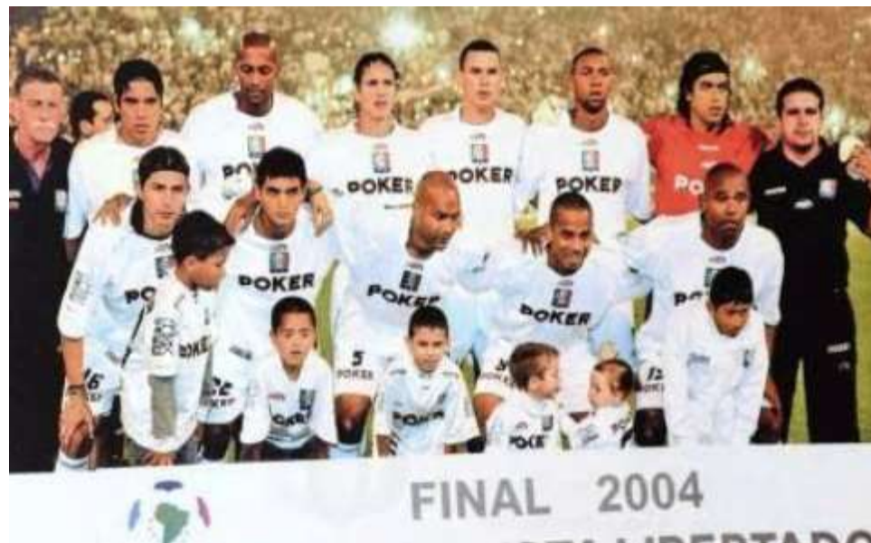
Figura 17. Equipo Once Caldas en la Copa Libertadores, Manizales, año 2004