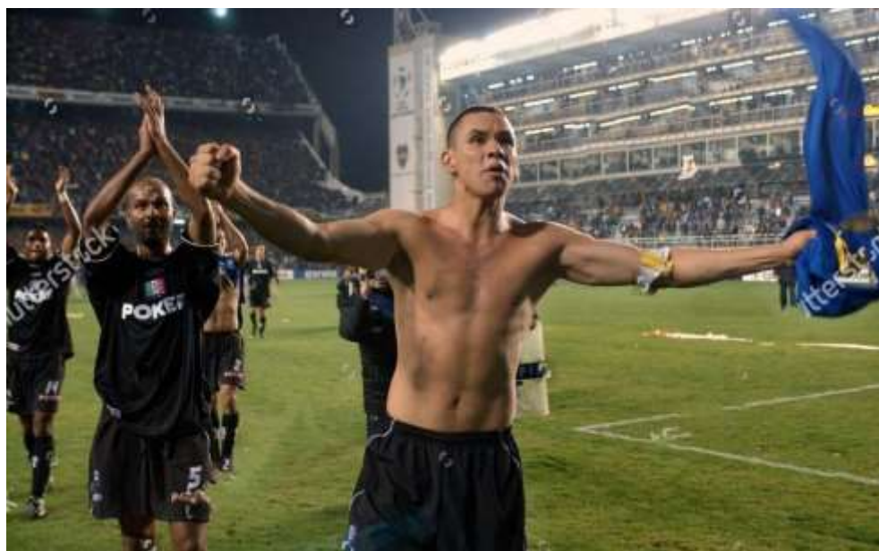
Figura 11. Celebración de jugadores del Once Caldas después del partido en Argentina

El encuentro en la ciudad de Buenos Aires, Argentina, estuvo acompañado de varios elementos alrededor del recibimiento por parte de los aficionados locales y visitantes. En este evento, los jugadores del Once Caldas pasaron de un momento de desesperación y de malos tratos, a ser elogiados por su buen juego y gran defensa. Además, empataron el partido y se trajeron a Manizales la fe intacta de que en casa se podía ganar.