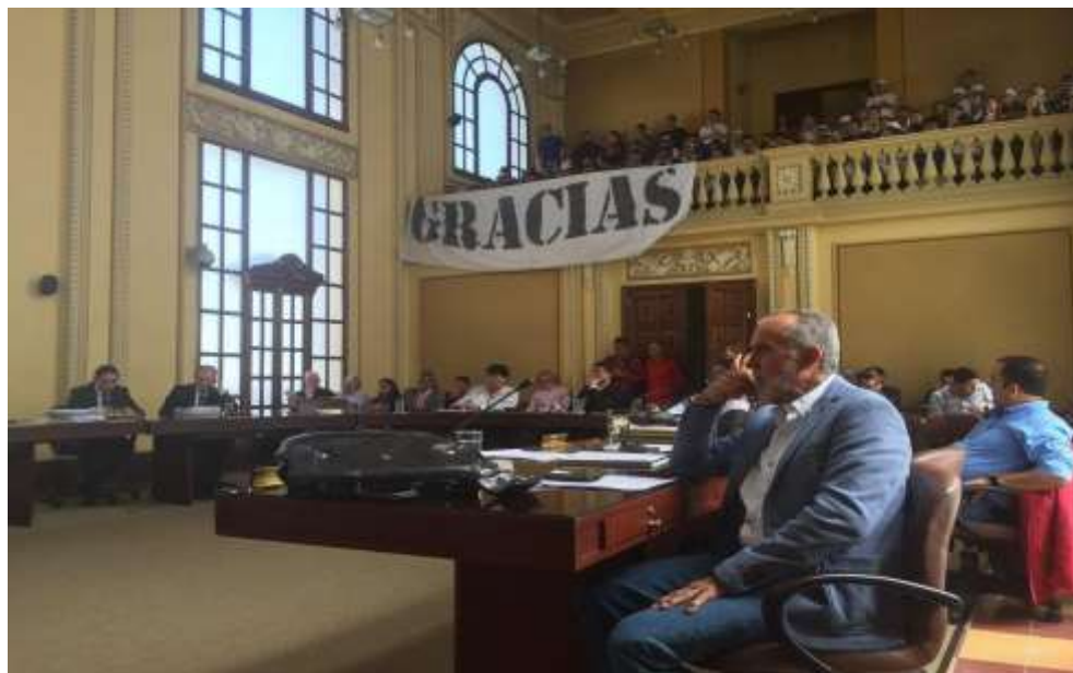
Figura 41. Sesión de la asamblea departamental donde se decreta el “Día del honor caldense”

El proyecto fue presentado por el líder de una de las barras del Once Caldas el 1 de julio de ese año y fue aprobado por los diputados en 4 sesiones. La propuesta está compuesta por 4 artículos, los cuales indican la fecha del 01 de Julio como día del honor caldense, “Donde el gobierno departamental contribuye, fomenta y promueve, el fomento de actividades deportivas, culturales y recreacionales con esta fecha. Así mismo, se promoverá que sea izada la bandera del departamento de Caldas, en todas las instituciones públicas del territorio” (Jiménez, 2016).