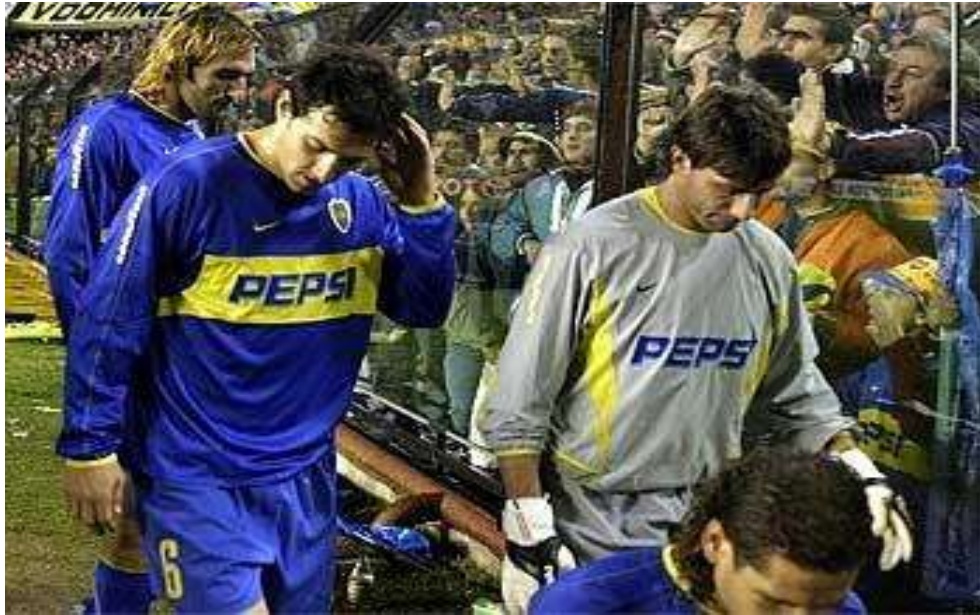
Figura 9. Final de ida en el Estadio La Bombonera, en Argentina, año 2004