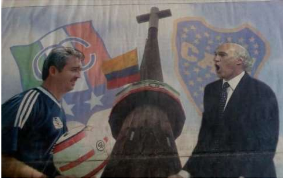
Figura 15. Montoya o Bianchi por la gloria