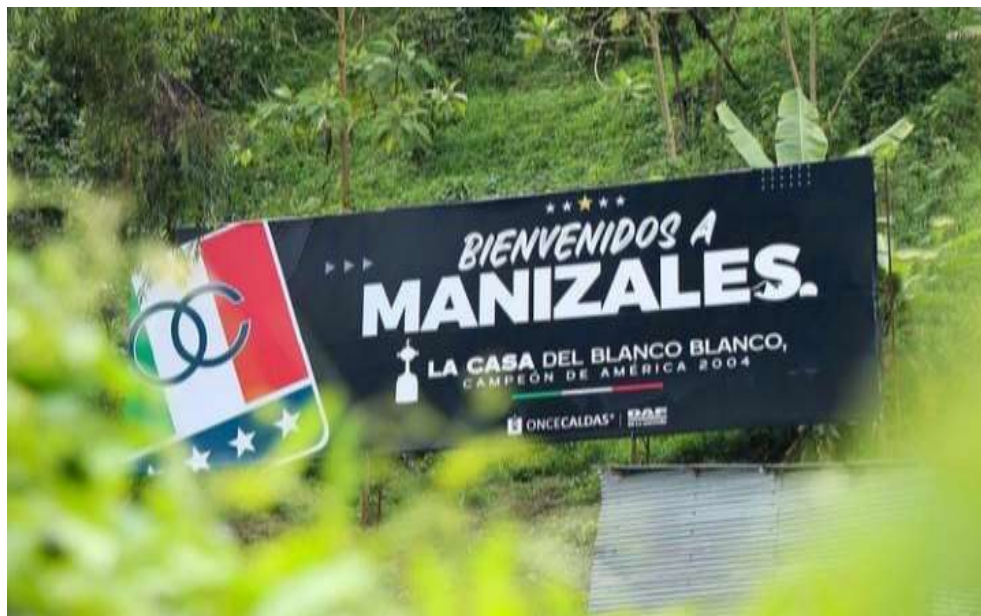
Figura 47. Valla en homenaje al triunfo continental, en Manizales año 2022

Cada año, la institución Once Caldas rinde homenaje de diferentes formas y busca estrechar relaciones con el hincha que ansioso de títulos se muestra inconforme con la manera en que el club ha orientado su manejo administrativo. En la Figura 47 se puede observar una valla que está al ingreso de la ciudad de Manizales, por los sectores de la estación Uribe ingresando a la ciudad de Manizales y por la Avenida batallón, subiendo hacia el barrio alta suiza. Estas fueron colocadas en el año 2022 para conmemorar los 18 años del triunfo de Copa Libertadores, recordando a quienes visitan Manizales que están ingresando en la casa del Campeón de América.