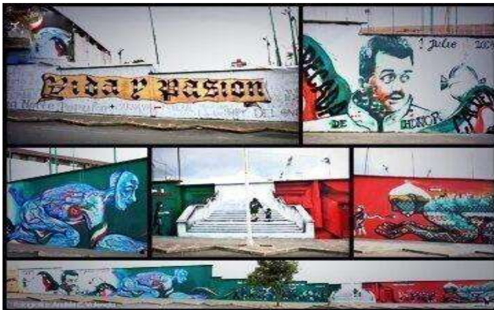
Figura 23. Mural en homenaje al profesor Luis Fernando Montoya, Manizales, año 2014

ubicado en la calle 62, por el costado norte del Estadio Palogrande, fue realizado para conmemorar los 11 años de haber ganado la Libertadores y en él se realiza un homenaje al profe Montoya. Alrededor del rostro se encuentra escrita una frase: “honor caldense”, con la cual fue bautizado el 1 de julio en Manizales. En este muro y en la memoria de los aficionados se plasmó la hazaña realizada por el técnico Luis Fernando Montoya, quien sacó campeón al equipo. Con esto, Montoya se ganó el apoyo y el cariño de los aficionados y generó empatía en las personas que recuerdan aquellos días en los que el técnico dirigió al equipo; trabajo con el cual le brindó alegrías a la ciudad y al país.