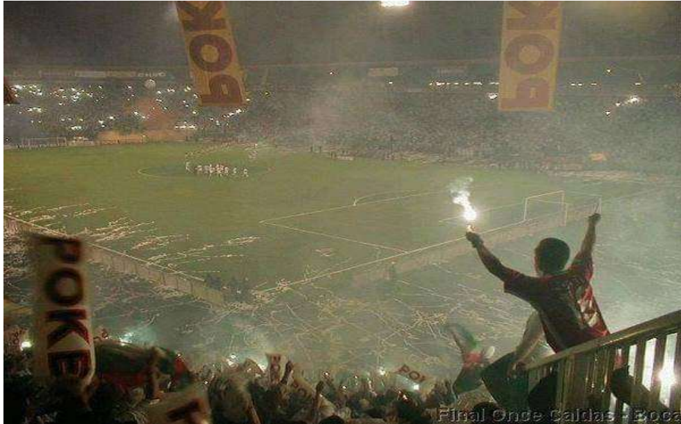
Figura 2. Salida de los equipos en la final de fútbol de Copa Libertadores Manizales, año 2004