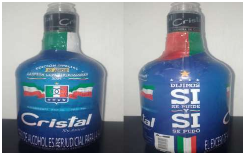
Figura 46. Conmemoración por los 10 años de Copa Libertadores

“Dijimos si se puede y si se pudo” fuera de esta frase otros detalles acompañan el diseño como la bandera tricolor, una estrella dorada sobre la frase que hace alusión al título y en la parte la parte del código de barras la figura de la Copa Libertadores.