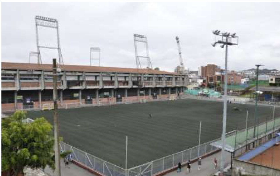
Figura 36. Cancha sintética Luis Fernando Montoya