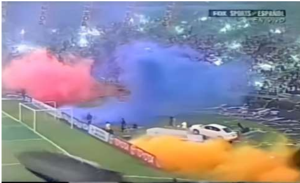
Figura 16. Salida en Manizales con los colores de la bandera de Colombia, año 2004

Las bengalas y las banderas estaban listas para recibir a los jugadores, a los periodistas y comentaristas de canales deportivos y en una señal para América narraron lo que sería una de las finales más importantes para Colombia y, sin duda, para el continente.