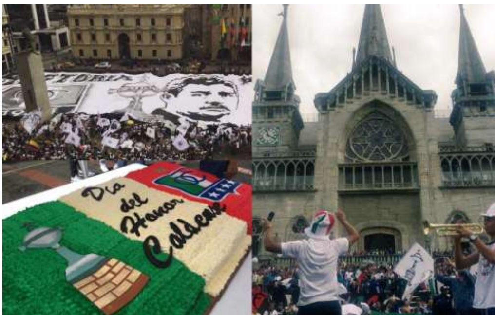
Figura 42. Celebraciones del 1 de julio en la plaza de Bolívar en Manizales