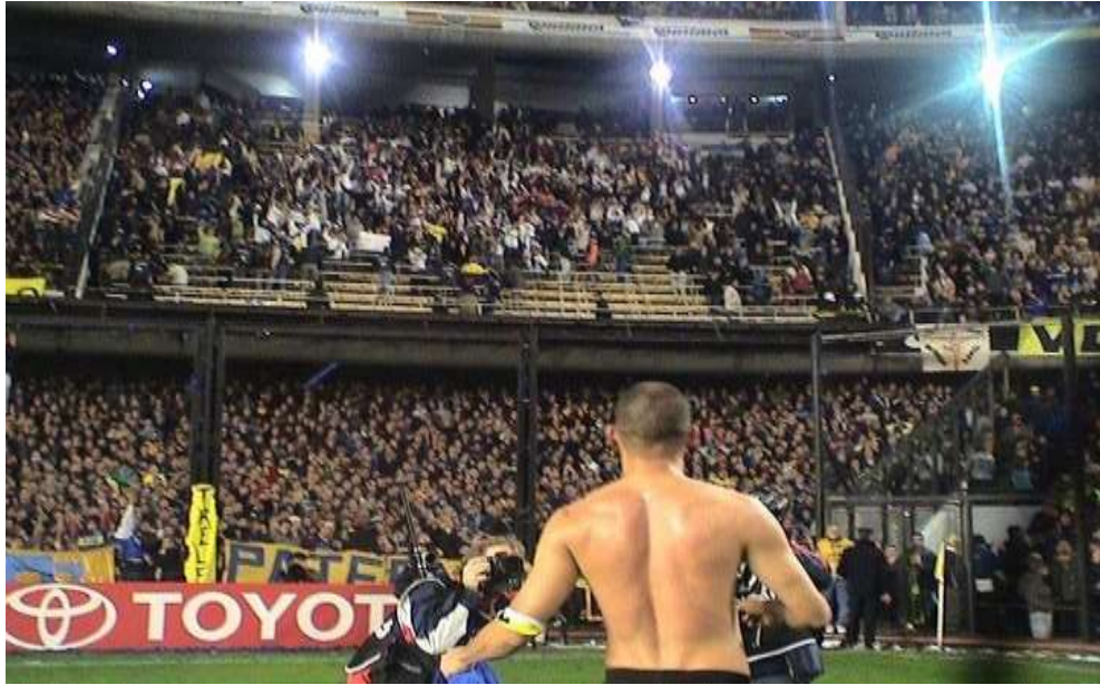
Figura 10. Celebración de los aficionados que acompañaron al Once Caldas en La Bombonera