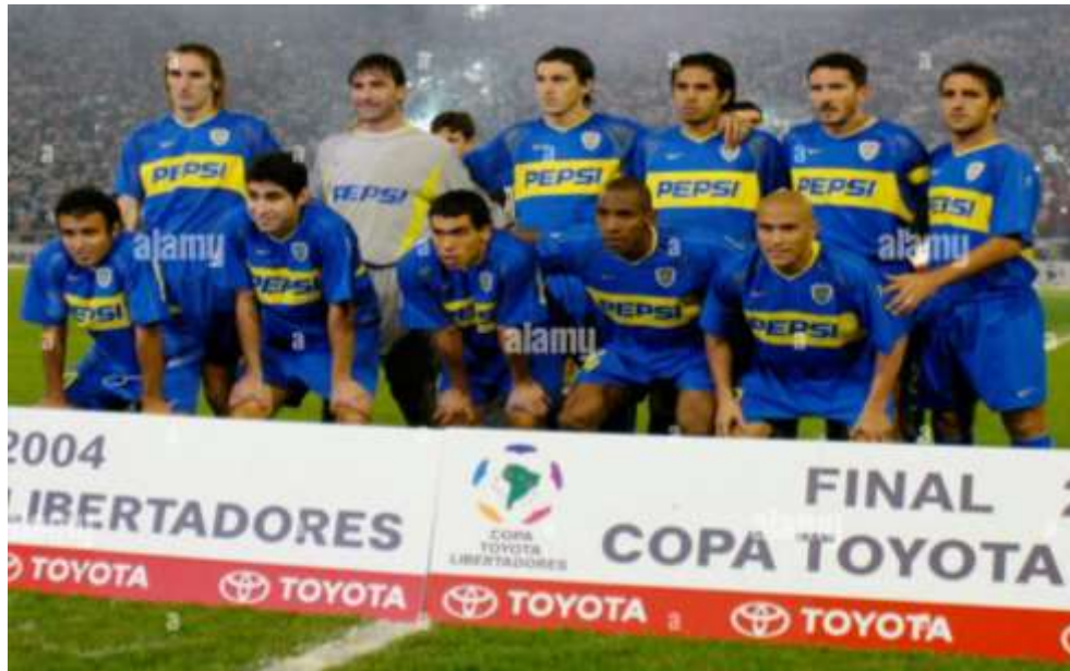
Figura 18. Equipo Boca Juniors Copa Libertadores, en Manizales año 2004