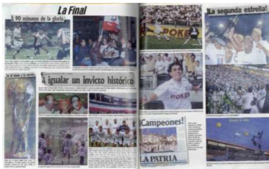
Figura 6. Final del fútbol colombiano torneo apertura, año 2003