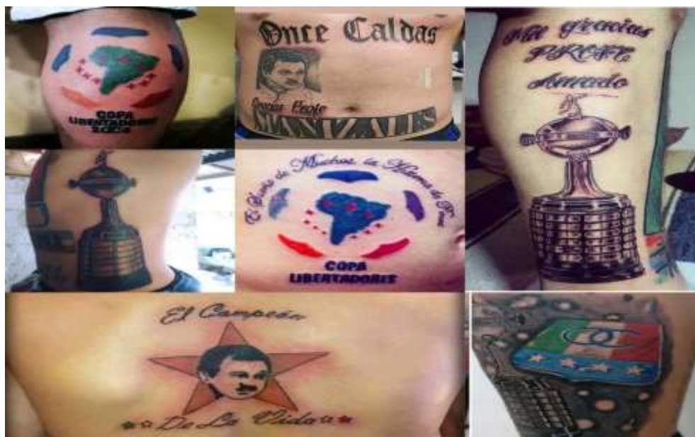
Figura 31. Tatuajes en honor a los jugadores y técnico del Once Caldas