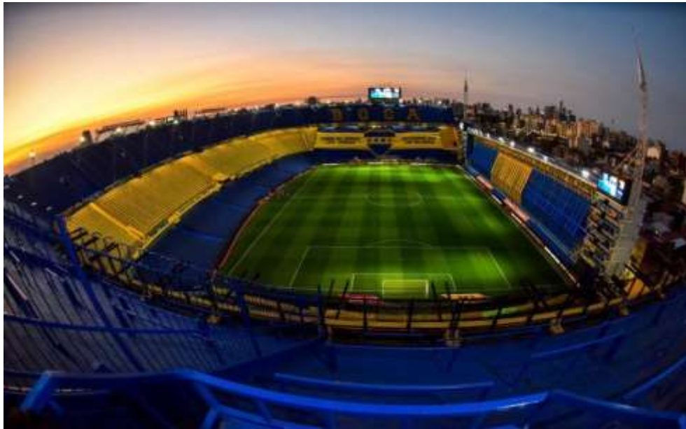
Figura 5. Estadio la Bombonera

Dentro y alrededor del estadio surgen diversas acciones, las cuales son realizadas en distintos tiempos, incluso durante el partido, pues no solo se ve el desarrollo de un juego, sino que otras acciones son realizadas por quienes se encuentran allí, como es el caso de cantar, festejar, gritar, comer, etc.