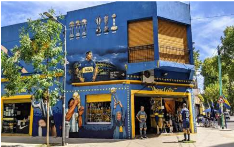
Figura 4. Barrio La Boca