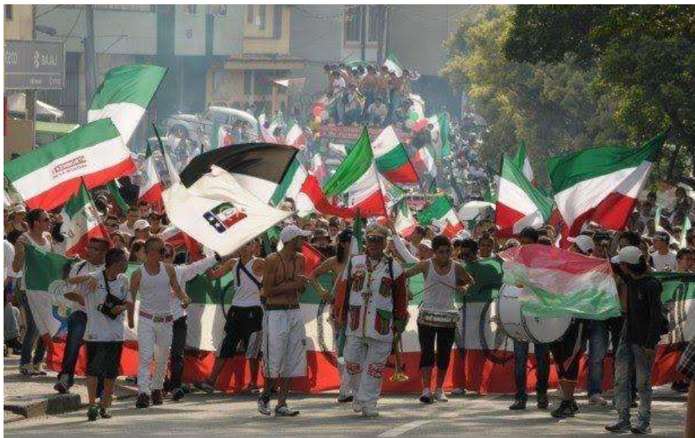
Figura 39. Conmemoración del triunfo de Copa Libertadores del Once Caldas