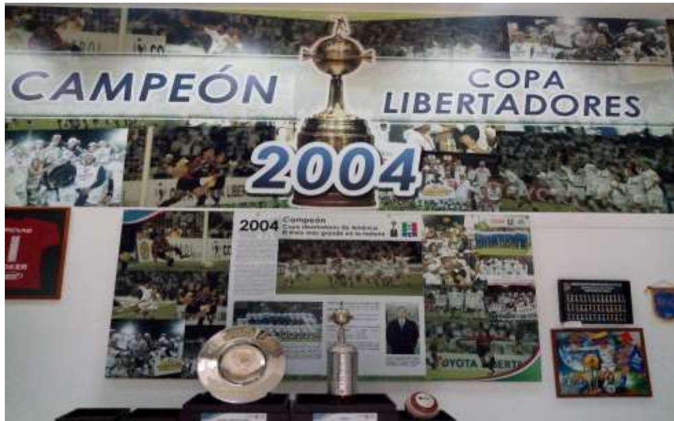
Figura 32. Museo del Once Caldas, Estadio Palogrande, año 2021

no volvió a ganar ningún título. Además de su historia en fotos y trofeos, existe un espacio para todo lo relacionado con el triunfo de la Copa Libertadores.