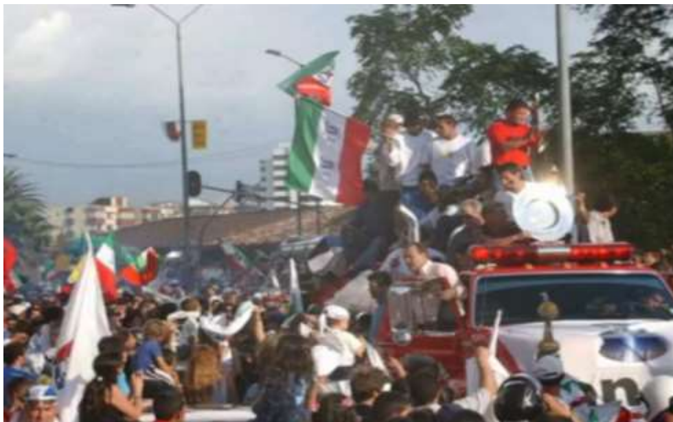
Figura 21. Celebración por las calles de Manizales el 5 de julio del año 2004