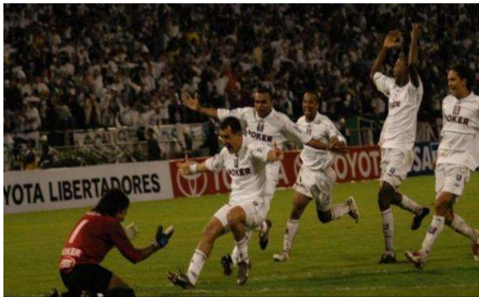
Figura 19. Jugadores del Once Caldas celebran el triunfo de Copa Libertadores