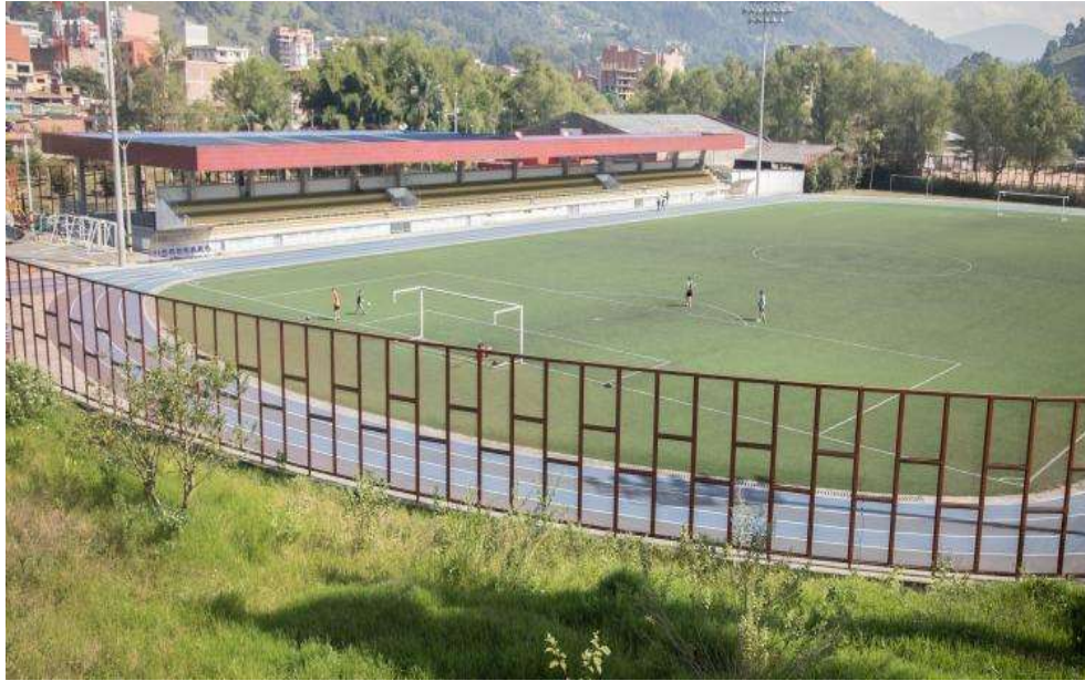
Figura 37. Estadio Luis Fernando Montoya en Caldas, Antioquia