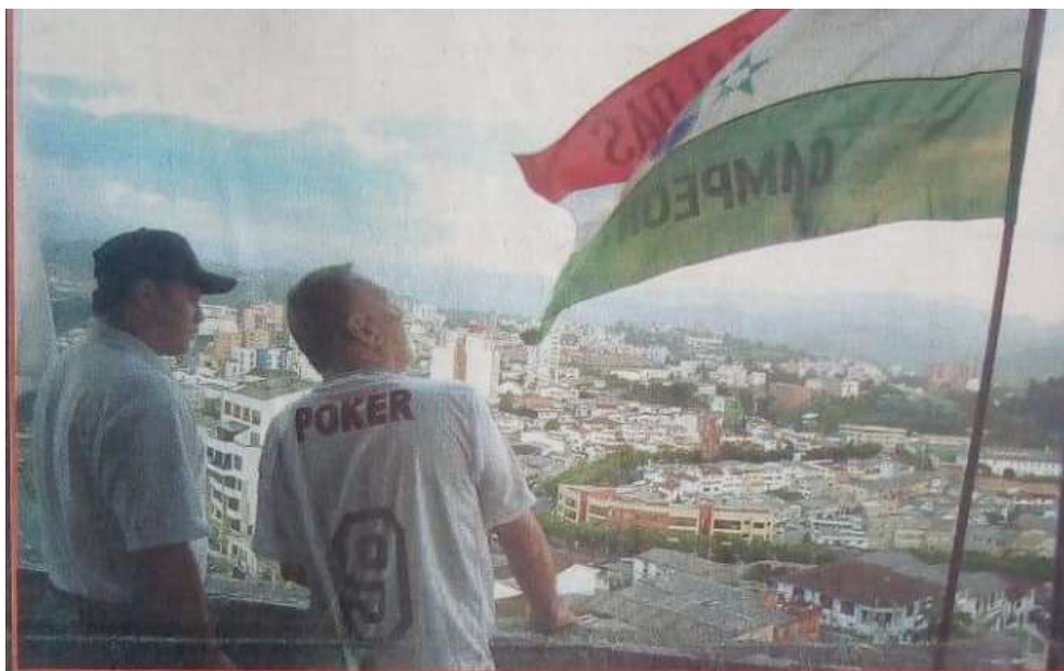
Figura 14. La ciudad vestida de tricolor