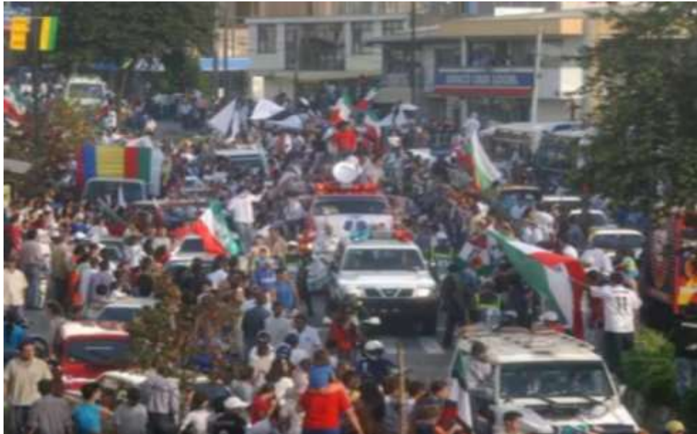
Figura 38. Celebración espontánea del año 2004

y para que los jugadores alcanzaran a leer sus dedicatorias que estaban en cada esquina, casa o lugar comercial. Este jolgorio fue una muestra del amor y sentido de pertenencia.