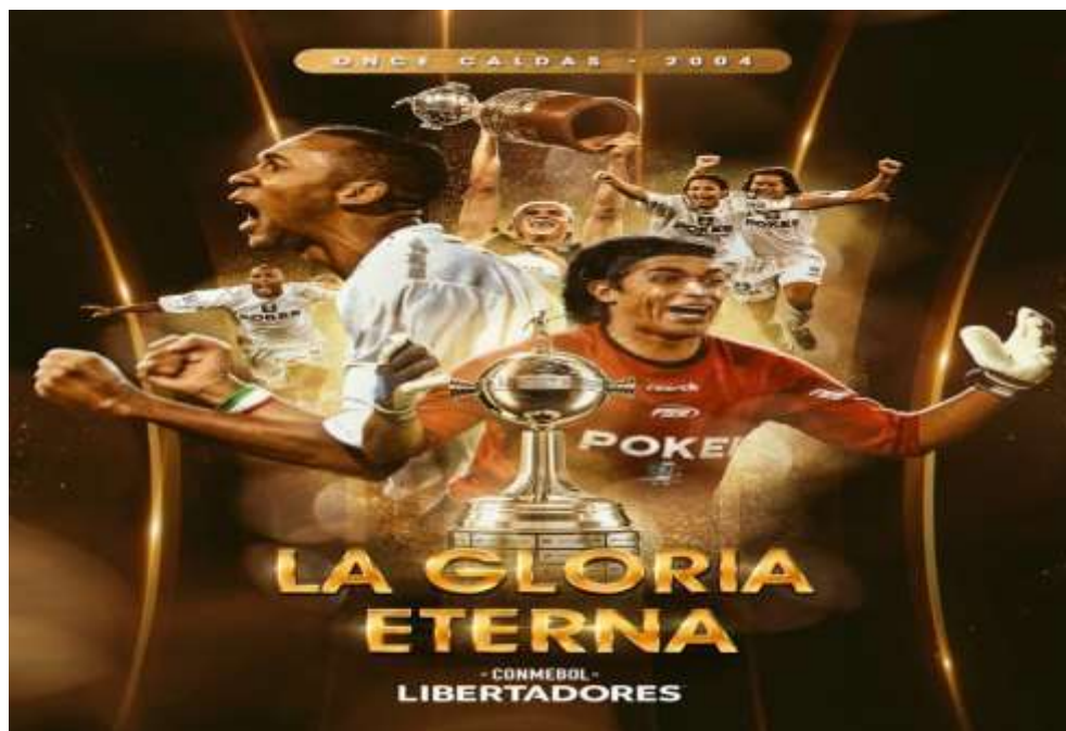
Figura 49. Homenaje de la Conmebol Libertadores al Once Caldas

Existen programas deportivos como el recuerdo del balón o expediente fútbol donde se pasan los partidos del año 2004 y hacen el reconocimiento al equipo blanco. En la Figura 49 la Conmebol Libertadores le rinde homenaje al Once Caldas por alcanzar la gloria eterna, este es el lema que rige para quienes logran alcanzar el título continental, el fútbol como deporte donde se ven involucradas emociones y sentires; los rituales se destacan en torno a este deporte que sigue prevaleciendo en el tiempo, el deporte rey que mueve masas, pero que también crea identidad colectiva en las personas que siguen a un equipo de fútbol.