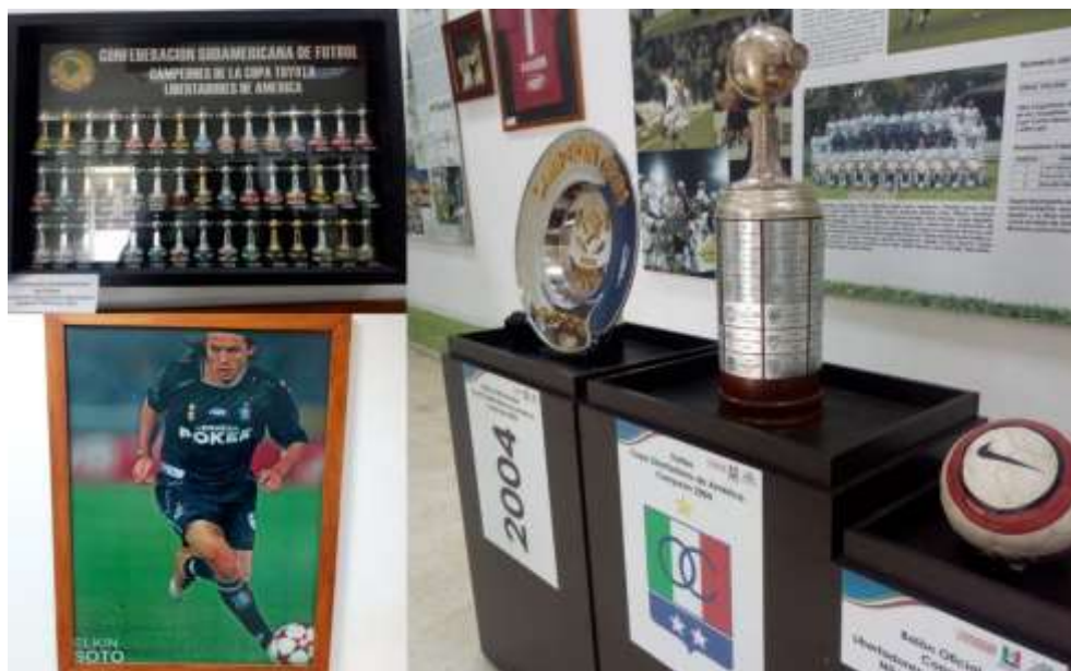
Figura 33. Detalles que se encuentran al interior del museo del Once Caldas