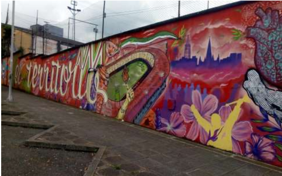
Figura 22. Mural en homenaje a la Copa Libertadores de América, Manizales, año 2022