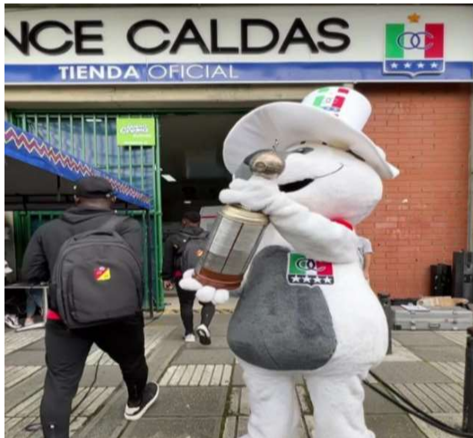
Figura 48. Provocación del Oso Blanco a jugadores del Pereira, Estadio Palogrande año 2022

Al igual que la valla, otras acciones son realizadas para tener presente esta hazaña histórica, es el caso de Blanco, la mascota del Once Caldas, un oso de anteojos cómo se puede observar en la Figura 48. En uno de los clásicos cafeteros realizados en el torneo colombiano en el año 2022, el Deportivo Pereira visitó al Once Caldas y el área encargada dispuso que la mascota del Once Caldas llevara la Copa Libertadores que se encuentra en el museo, la cual utilizó para el recibimiento de los jugadores del Pereira.