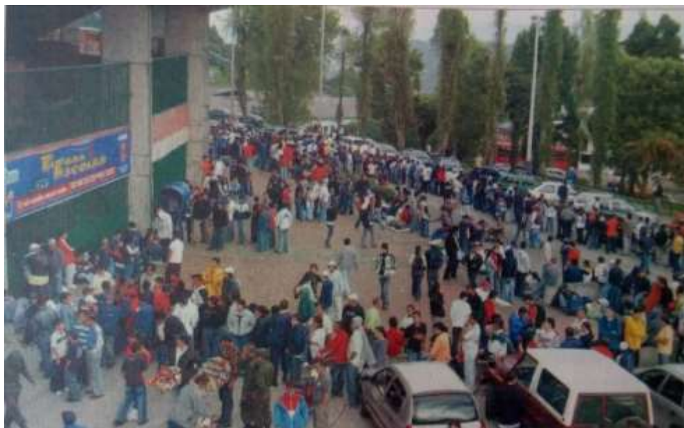
Figura 12. Venta de boletería final Once Caldas vs Boca Juniors, Estadio Palogrande

La boleta lo valía todo, aunque era necesario cumplir los requisitos y tener las dos últimas colillas de los partidos jugados en Manizales por la Copa Libertadores de América. Quienes adquirieron la entrada estaban felices y los que no tenían lo solicitado buscaban con desesperación a alguien para que se las vendiera. La ira fue otra de las emociones encontradas en medio de este acontecimiento; los abonados, por ejemplo, relataron a los medios de comunicación que no recibieron un buen trato, pues, aunque eran hinchas fieles, tuvieron que esperar horas y soportar largas filas porque solo se les habilitó una taquilla.