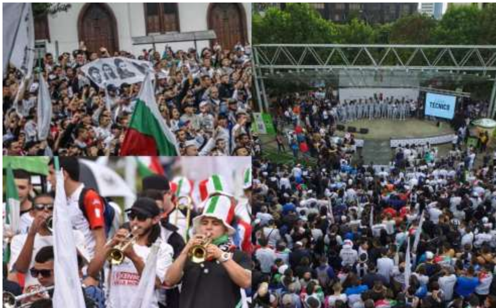
Figura 43. Celebración del 1 de julio en el parque Ernesto Gutiérrez

La palabra nostalgia proviene del griego nostos volver a casa, y algia , estado doloroso. Siendo así, un anhelo doloroso de volver a casa, en el caso de esta investigación sería volver al día en que se gana la hazaña y el recordarlo lo hace doloroso por la situación de llevar más de 11 años sin un título local.