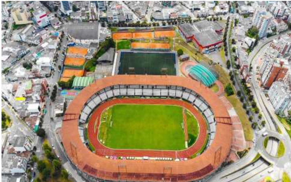
Figura 3. Unidad deportiva Palogrande

campeón de la Copa Libertadores de América, en el año 2004. Y, en la parte superior, se encuentran varias canchas de tenis.