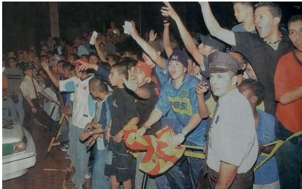
Figura 13. Hinchas del Pereira recibiendo al equipo Boca Juniors, Pereira año 2004

La Figura 13 permite ver que los hinchas del Pereira portan camisetas del Boca Juniors mientras hondean las de su propio equipo con la mano y reciben, entusiasmados, a la delegación del Boca Juniors, el 29 de junio del año 2004. En horas de la noche, los pereiranos llegaron hasta el aeropuerto y, también, se movilizaron hacia los alrededores del hotel en el que se hospedaron los jugadores del equipo argentino mientras viajaban a Manizales para hacer los respectivos reconocimientos de la cancha. “Bianchi prefirió hacer una escala en Pereira, ubicada a 1.188 metros, para tratar de reducir los efectos de la altura de Manizales, de 2.150 metros” (myplainview, 2004) y fue tanta la conmoción de los aficionados pereiranos por buscar un autógrafo o una foto con las figuras del club Xeneize que la nómina y el cuerpo técnico prefirieron no bajar del bus y solo los observaron con cierta indiferencia desde las ventanas.