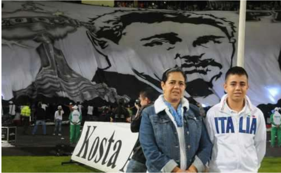
Figura 29. Homenaje al Profesor Montoya por los 10 años de Copa Libertadores