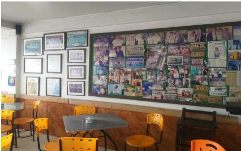
Figura 35. Museo de la cafetería Versalles, en Manizales, año 2022