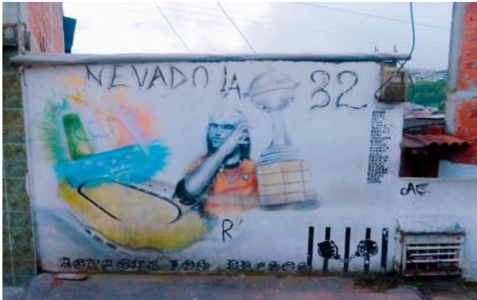
Figura 26. Mural de la "Araña Henao" barrio Nevado, año 2022

Los aficionados no solo territorializan emociones evocadas por el triunfo de la Copa Libertadores, también exponen lo que viven como colectividad y las situaciones cotidianas por las que pasan, tal es el caso del barrio El Nevado, donde se le rinde un homenaje a los privados de la libertad.