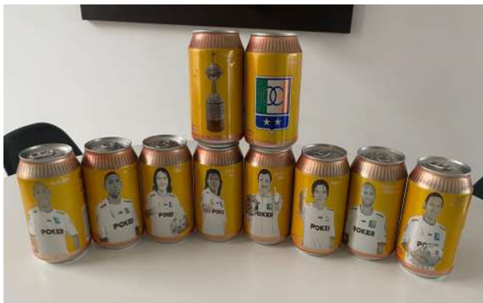
Figura 45. Colección de latas de cerveza en homenaje al club Once Caldas del año 2004

El recuerdo de la prensa deportiva e informativa cada año le ofrece un espacio en periódicos, televisión o redes sociales, al igual que el club y los directivos que intentan apaciguar el enojo y la frustración del aficionado blanco que reclama volver a estas épocas y que no son suficientes las muestras de agradecimientos a las glorias pasadas, siendo necesario ganar de nuevo y vivir momentos como el de la década donde al equipo blanco se le consideró el mejor de Colombia.