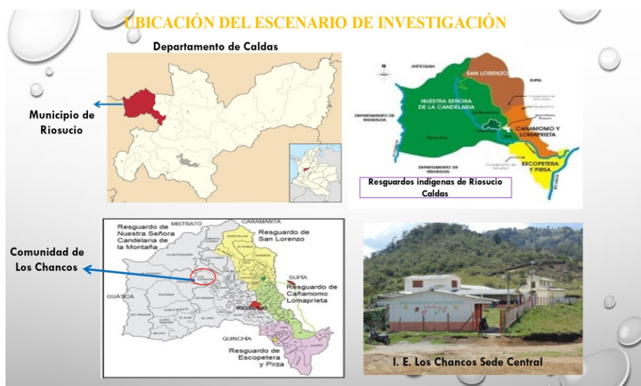
Ilustración 1.ubicación del escenario de investigación