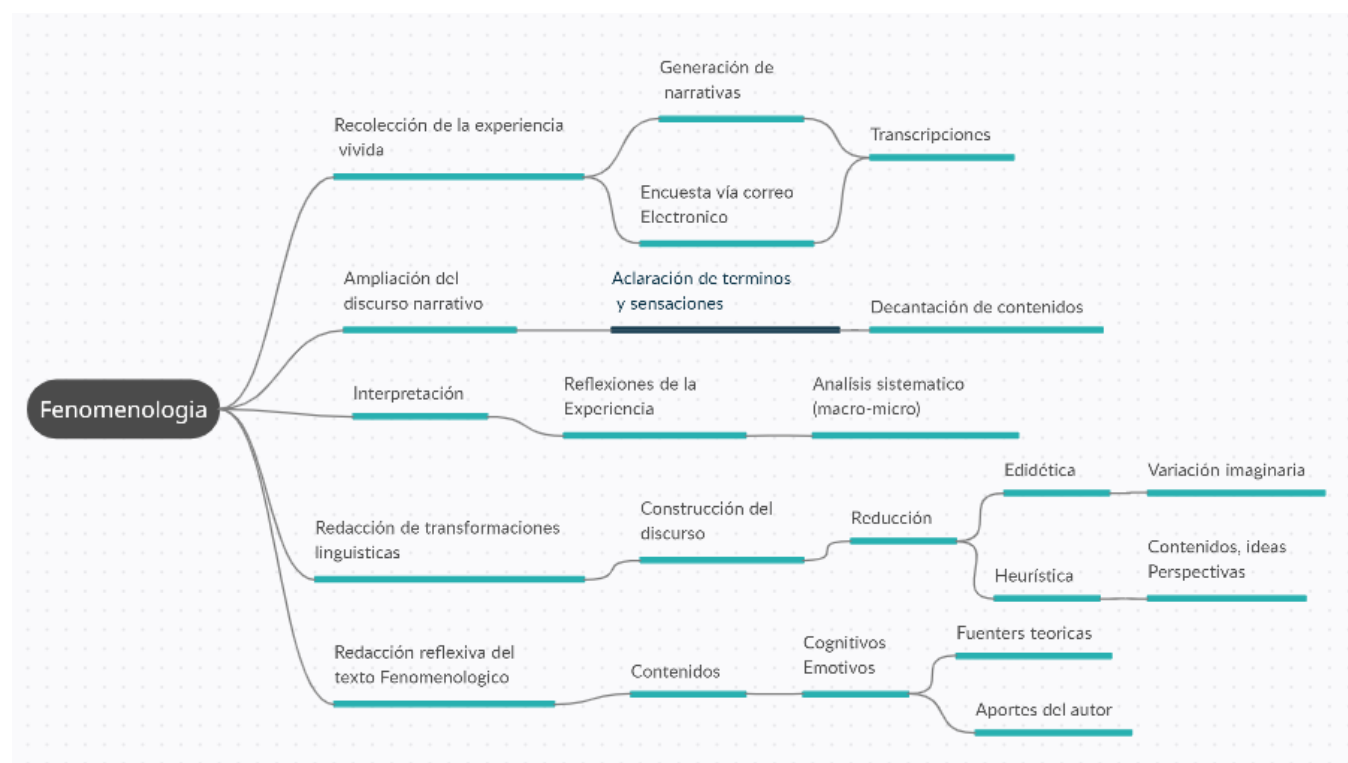
Ilustración 3. metodología

Esto se puede ver de una forma más detallada en la ilustración 3