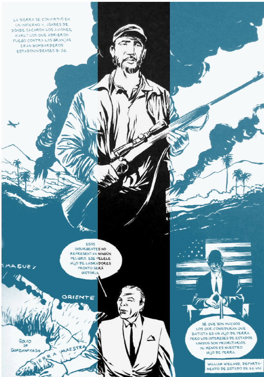
▪ Castro, 2011 | Reinhard Kleist | S.A. Norma Editorial