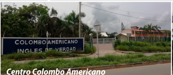
Centro Colombo Americano