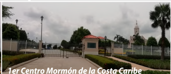
1er Centro Mormón de la Costa Caribe