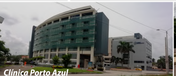
Clinica Porto Azul