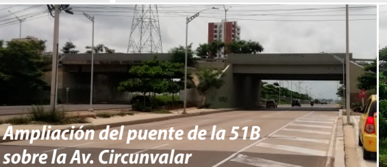
Ampliación del puente de la 51B sobre la Av. Circunvalar