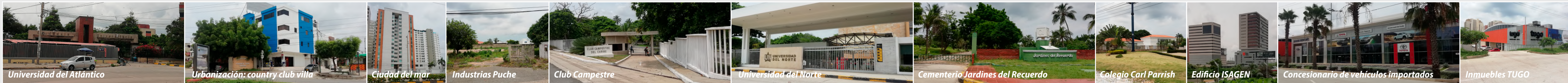
Universidad del Atlántico