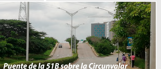
Puente de la 51B sobre la Circunvalar