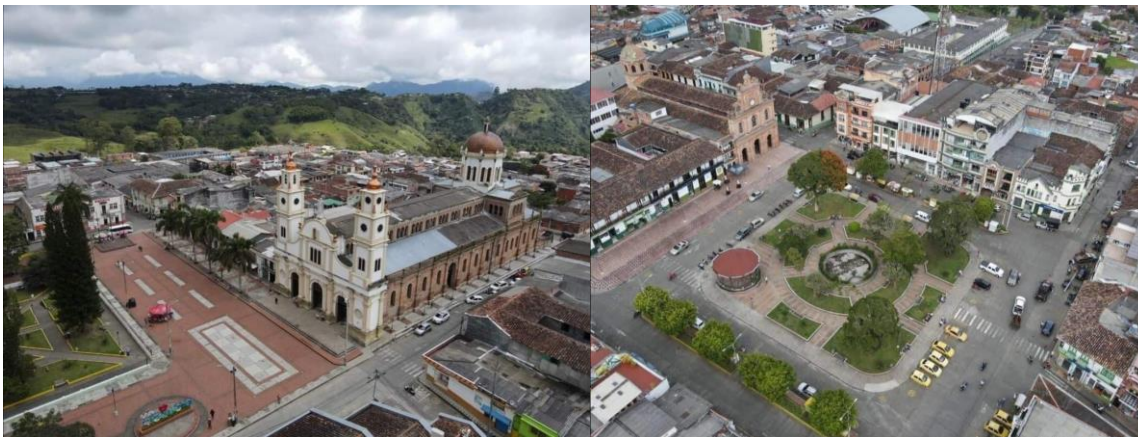
Vista panorámica de las dos plazas San Sebastián y la Candelaria, material disponible en página de Facebook “El Riosuceño”

Es importante comprender que la educación es un factor clave en el avance hacia sociedades más igualitarias, por lo que se hace necesario que dentro de los espacios educativos se involucre el contexto social, cultural, económico, organizativo, entre otros como un aspectos vitales y relevantes para la formación de los ciudadanos, es por esto que le educación juega un papel de gran importancia dentro de estos procesos, pues en esta están las bases de la sociedad y de las personas que la conforman. Como nos dice Salcedo (2008):