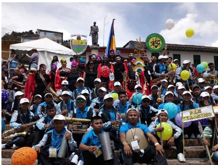
Encuentro de Bandas, acompañado por el grupo de danzas de la comunidad

La investigación se ha convertido en un factor de gran importancia para la sociedad y es básicamente este proceso el que ha permitido el avance en todas las áreas de conocimiento, y por ende el descubrimiento de múltiples factores de gran relevancia para el desarrollo de los procesos. Es por esto que como nos dice Esteban (2018):