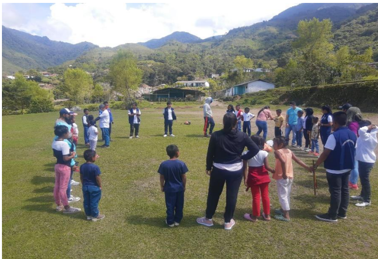
Actividad lúdica y de esparcimiento en la comunidad de Bermejil después de la avalancha.

Como lo dice Noguera, M. E. (2018). La palabra Moral procede del vocablo latino mores que significa costumbres o tradiciones. No existe ninguna cultura o sociedad que no tenga sus costumbres o tradiciones, y que no enseñe a sus jóvenes a ajustarse a ellas. Pág. 1, por lo cual es de gran importancia para cada contexto educativo que sus estudiantes tengan un desarrollo ético y moral acorde con las costumbres y tradiciones que se tienen en el contexto.