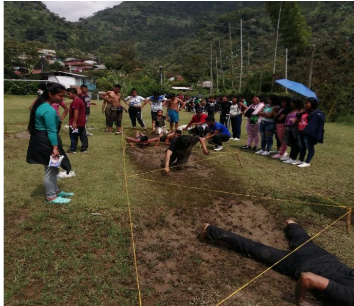
Pista de obstáculos en el día deportivo

Con el paso de los años y el desarrollo de las tecnologías el termino competencias se ha ido fundamentando y fortaleciendo cobrando gran importancia dentro de la sociedad, refiriéndonos específicamente al ámbito educativo, y comprendiendo el concepto de Muñoz y Araya (2017):