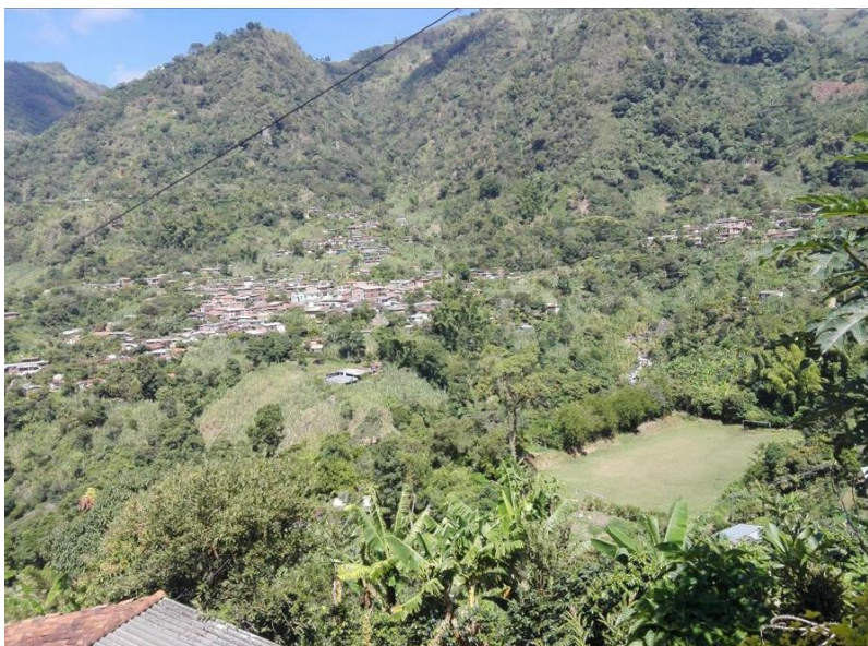
Comunidad de San Jerónimo

Cuando se habla de territorio es importante indicar que el contexto o territorio que se habita es de gran importancia para cualquier persona, en especial para los pueblos indígenas, pues en éste básicamente se identifican diferentes connotaciones y relaciones que han llevado a la formación de culturas específicas en cada uno de ellos, tienen sus raíces en territorios