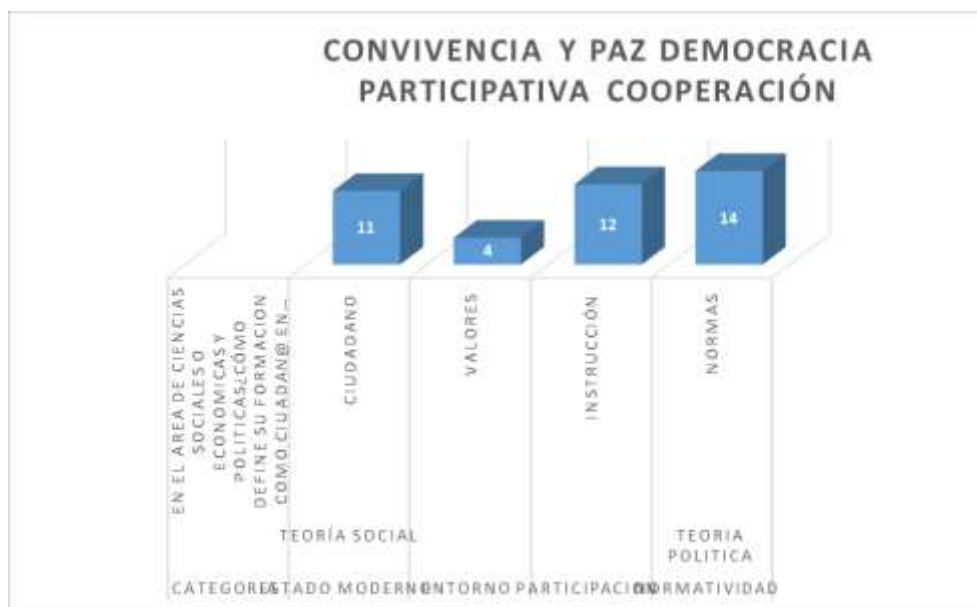
Gráfico 2. Ciudadanía 3. Convivencia y Paz- Democracia participativa - Cooperación

La tarea de la sociedad en un ambiente participativo, González, Santisteban (2016) “las diferentes estrategias que aportan a la formación en ciudadanía, son ocupaciones de una sociedad interesada en ahondar en la justicia social y la democracia” (p.92)