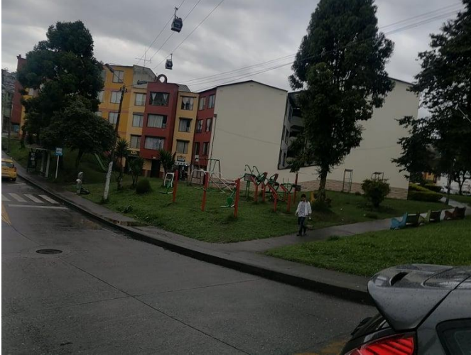
Imagen 12. Parque Villa Carmenza, A. Gil. 2022

Esta zona es de un importante flujo comercial, ya que en su espacio cuenta con restaurantes, tiendas, barberías y veterinarias. Además de contar con un espacio deportivo de gran magnitud como es la cancha de arrayanes que para el año 2022 la alcaldía de la ciudad decidió intervenir y mejorar el escenario deportivo.