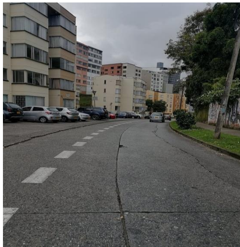
Imagen 10. Edificios Milán, A. Gil. 2022.

Entre lo que confirma en la entrevista, la mayoría de su vida vivió en el barrio Milán, el cual es una zona considerada “Rosa” o de entretenimiento de la ciudad de Manizales. En este lugar se pueden encontrar diferentes actividades económicas en las cuales destacan los bares, restaurantes y las fábricas como MABE e INCOLMA; además, de ser un área cercana a miradores importantes en la ciudad como el del Cerro de oro el cual es un atractivo más del sector.