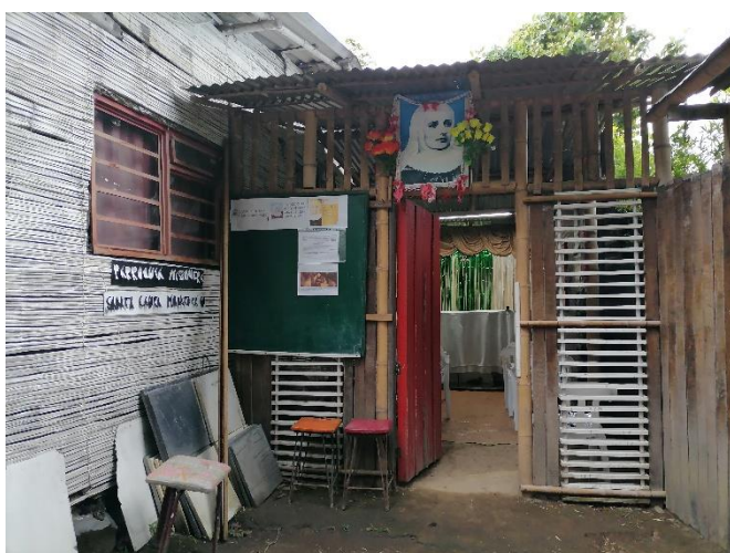
Imagen 4 Capilla, A. Gil. 2021.

En este momento de la investigación, se buscó desarrollar visitas que respondiesen a un orden concreto en diferentes días y horarios de la semana. El fin de estas entrevistas fue