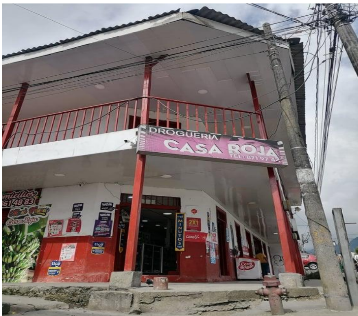
Imagen 13. Casa roja