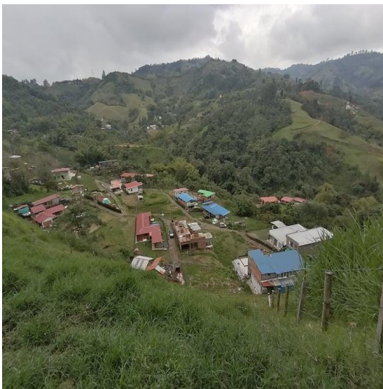
Imagen 3 Villa Fabiola actual, A. Gil. 2022.

significado de los espacios, algunos, representan más allá de áreas comunes utilizadas por las personas, se convierten en espacios simbólicos y toman un carácter valioso para todo aquel que decide habitar el lugar. (Véase imagen 3).