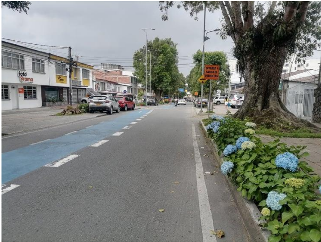
Imagen 11. Bulevar de Milán, A. Gil. 2022.

En este caso, el proceso de urbanización ha sido acelerado puesto que el mismo espacio pasó de ser un barrio residencial a convertirse en un sector importante de la vida nocturna en Manizales. Esta situación hizo que en este sitio se presentaran problemáticas como lo es la inseguridad y el alza de precios sobre los productos que allí se comercializan en las tiendas.