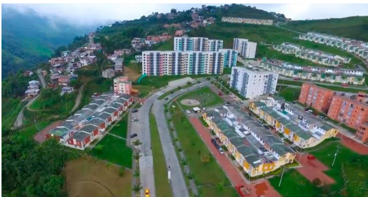
Imagen 15. Puertas del sol constructora. (2019). Ciudadela Puertas del sol. https://acortar.link/TAPrt8

mismo y posterior a eso, me fue a vivir a la Enea ya al final me fui a vivir a Manizales y vi que mi barrio no era ni una pizca de lo que yo conocí” Calle (2021).