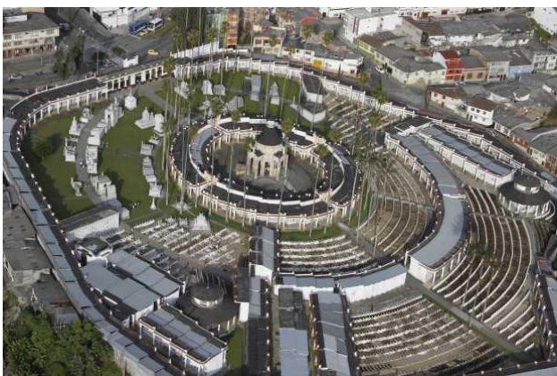
Imagen 9. Cementerio San Esteban, La patria. 2015.

entre ellas adineradas (en sus primeros mausoleos), de clase media y los restos de personas sin identificar (parte trasera). (véase imagen 9)