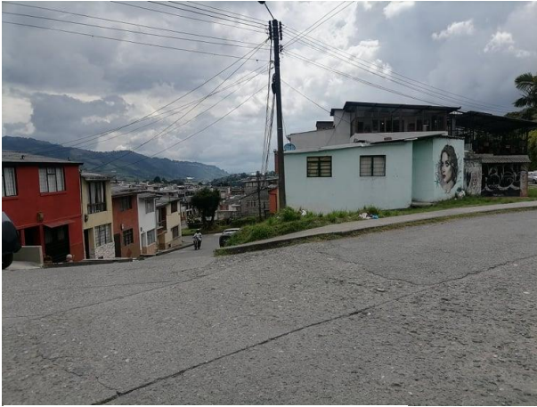
Imagen 14. La Enea, A. Gil. 2022.

Sierra Ochoa, además de contar con estructuras emblemáticas como casa roja, la cual ha servido como punto de encuentro e identidad de la comunidad por la conservación de paisajes históricos en su estructura (véase imagen 13).