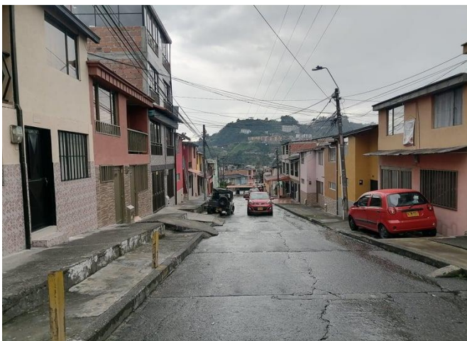
Imagen 6. Casas La pradera, A. Gil. 2022.

En esta parte de la ciudad también podemos encontrar la vivienda de dos hermanos que se entrevistaron en Villa Fabiola. Su casa está ubicada en una zona residencial que, por el tamaño de las casas, alberga en su mayoría familias con considerables cantidades de miembros (véase imagen 6).