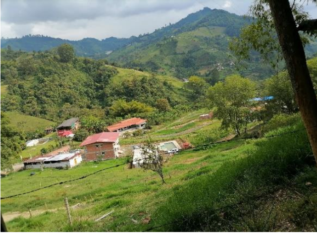
Imagen 2 Lotes divididos, A. Gil, 2020.

Este proyecto de vivienda, busca establecer una colectividad de migrantes ciudadanos. Este colectivo, vive bajo la lógica del modelo de comunidad rural o modo de vida sustentable en varios niveles 1 . El proyecto es direccionado en su nivel social y jurídico desde la misma comunidad. Esta es representada bajo la figura de acción comunal, la cual, busca formalizar y modificar el uso del suelo para facilitar la construcción a una mayor escala, además de construir ambientes comunitarios (parques, mercados comunales y carreteras) y así mismo, gestionar dineros o bienes para la comunidad.