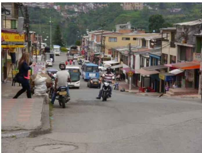
Imagen 5. Garcia,j. (2018). Barrio La pradera. https://acortar.link/i8MfD8

La tradición del sector ha sido ser una zona de relativa tranquilidad, en donde varias familias han habitado desde el año 84 que se comenzó la urbanización de la zona y que aun el día de hoy continúan allí.